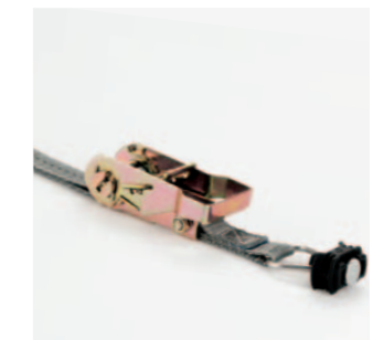
Zurrgurte mit Ratsche