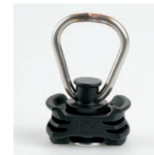
Fitting für Zurrschiene