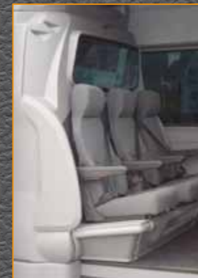
Option: Armlehnen für 3 Einzelsitze