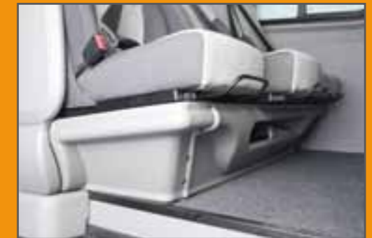
Sitzbank mit Aufbewahrungsfach