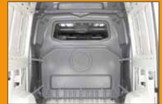
Basis, Rückansicht ohne Durchlademöglichkeit