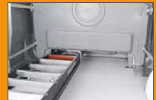
Rückansicht bei Durchlademöglichkeit