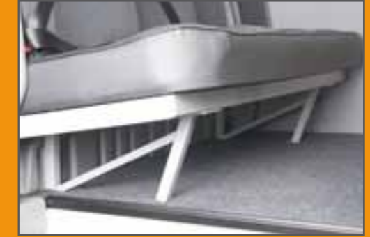
Basis ohne Durchlademöglichkeit