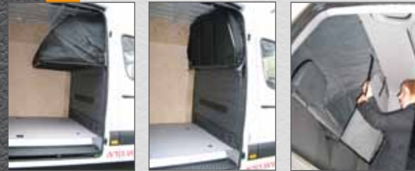
Produkt "Biwak". Klappbett in Transporterkastenwagen