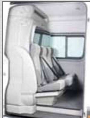
Lieferbar mit Sitzbank oder separaten verschiebbaren Einzelsitzen