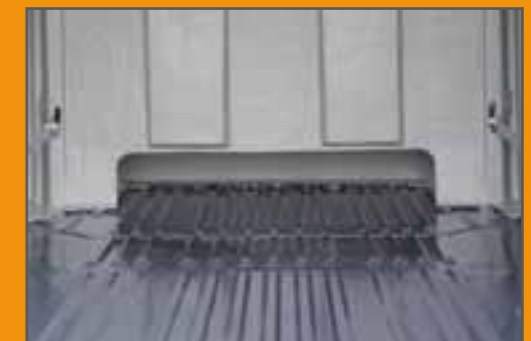
Rückansicht bei Durchlademöglichkeit