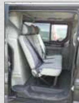
Trennwand C-Säule hinter 2. Sitzreihe Originalbestuhlung