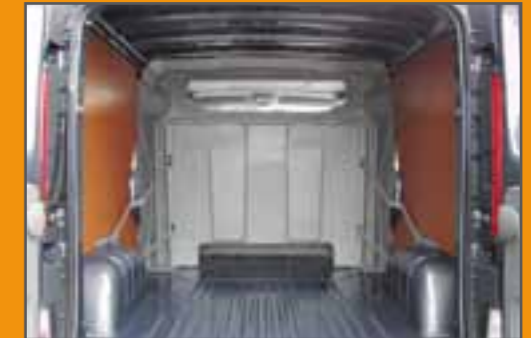
Basis, Rückansicht ohne Durchlademöglichkeit