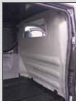
Trennwand hinter 1. Sitzreihe