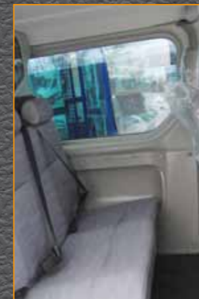
Wandverkleidung mit Fensterrahmen und vorgeformter Himmelverkleidung