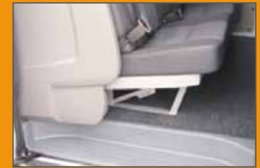
Basis, ohne Durchlademöglichkeit