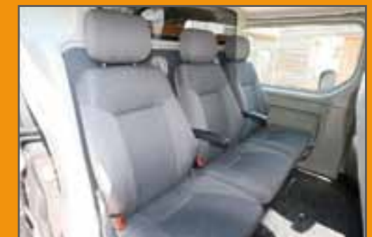
Option: Armlehnen für 3 Einzelsitze